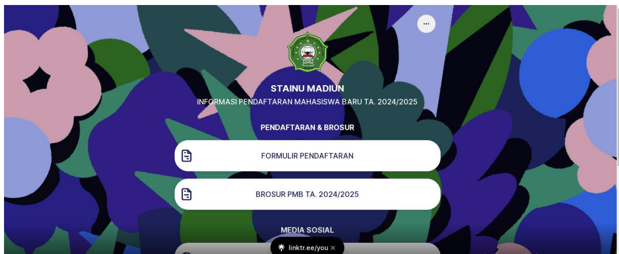
Gambar 4.1. Laman Pendaftaran PMB